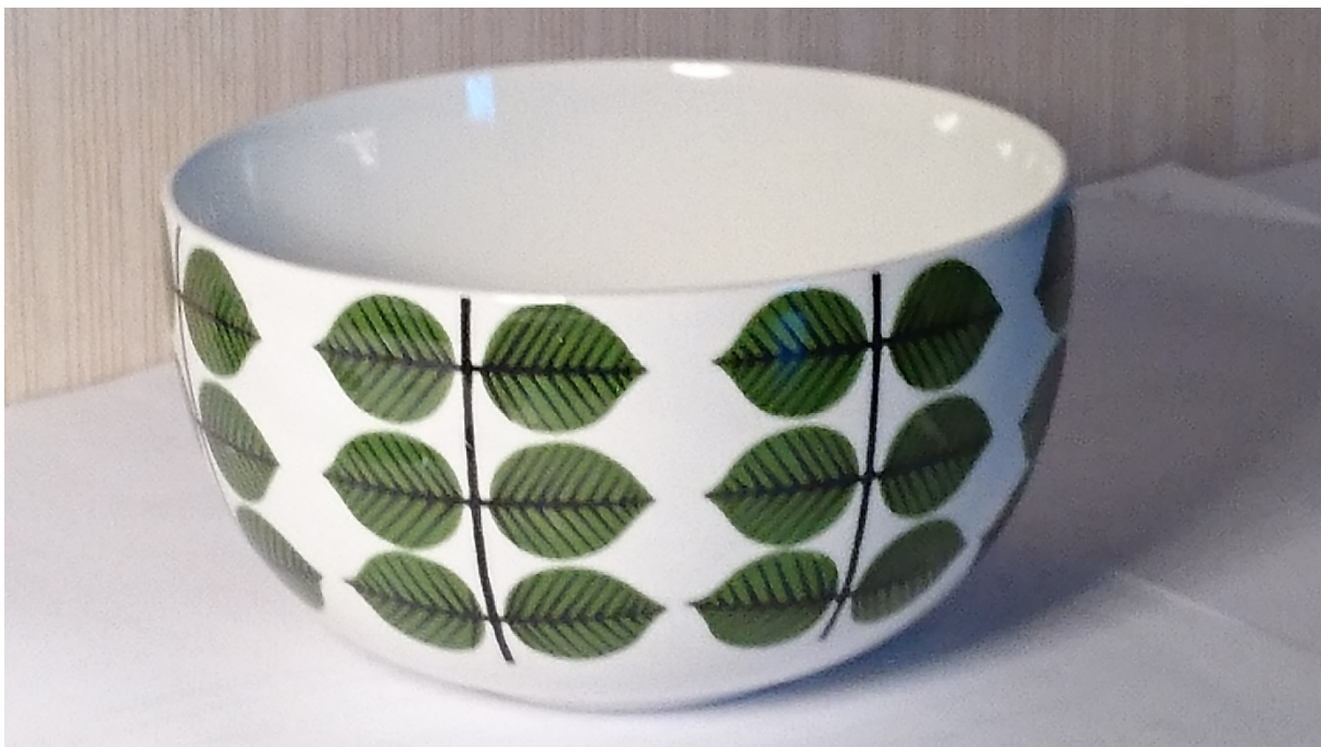
En skål ur servisen Berså av Stig Lindberg

Jag tycker om att ta ansvaret för FINNSAM:s medverkan under de årliga Släktforskar dagarna. Förutsatt att vi får tillräckligt med bidrag från olika håll har jag möjlighet att lära känna en ny stad varje år. Gärna anländer jag någon dag innan mässan börjar för att hinna bekanta mig med den aktuella staden. Den här gången var det Umeå som gällde.