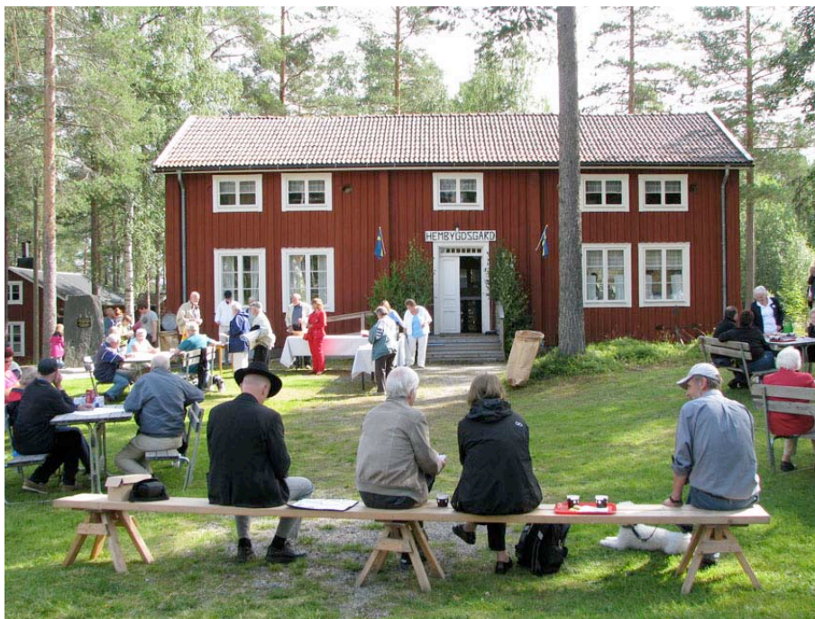
Björna hembygdsgränd, flyttad från Movattnet

Projektarbete Kursen Skogsfinnarna i Skandinavien Mälardalens Högskola 7,5 poäng HT 2009 Tord Eriksson