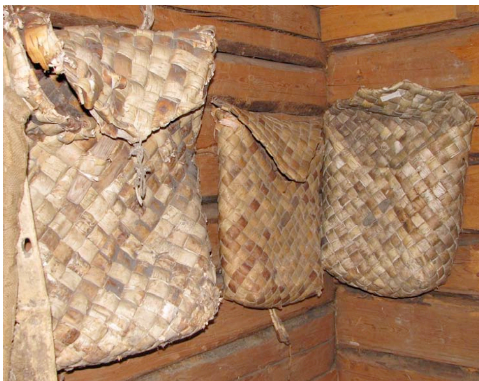
Näverkontar i Själevads hembygdsgård