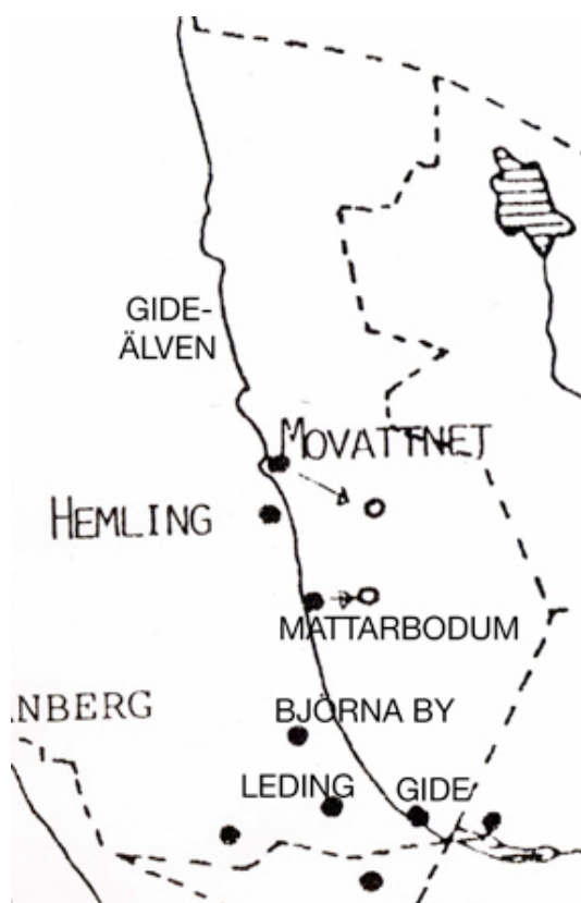
Byar i norra Själevad (Björna socken) i början av 1600-talet

Björna blev egen församling 1795. Området utgjorde tidigare den norra delen, eller ”fjällfjärdingen”, inom Själevads socken. Trehörningsjö blev egen socken 1864. Innan dess var det en del av Gideå, som i sin tur var den norra delen av Arnäs socken till år 1807. Inom det som blev Björna fanns vid början av 1600-talet endast sju byar, de flesta längs Gideälven.