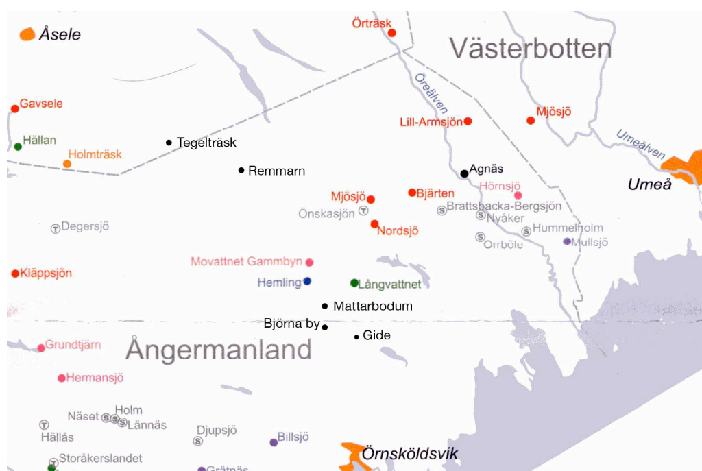
Finnbosättningar i Norra Ångermanland enligt Maud Wedin 111 med mina tillägg

de nedre delarna av socknarna. De gjorde jakt- och fiskefärder långt upp från kusten långt innan finnarna kom och hade antagligen namn på de platser de besökte. Vid den stora nykolonisationsvågen från mitten av 1700-talet flyttar många från de svenskspråkiga delarna av socknarna upp till "fjällbygden". De dominerade snart till antalet, samtidigt som minoritetsspråket långsamt dog ut. Detta är kanske den viktigaste anledningen till att finnarnas benämningar på platser inte har bevarats? I Viksjöområdet fanns knappast utrymme för en motsvarande förtätning av den svenska befolkningen.