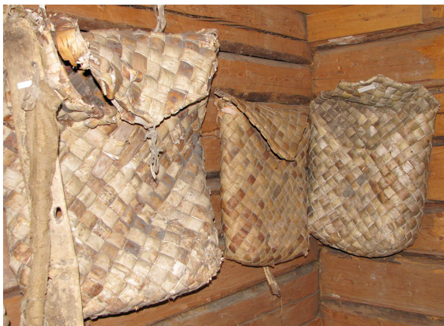
Näverkontar i Själevads hembygdsgård