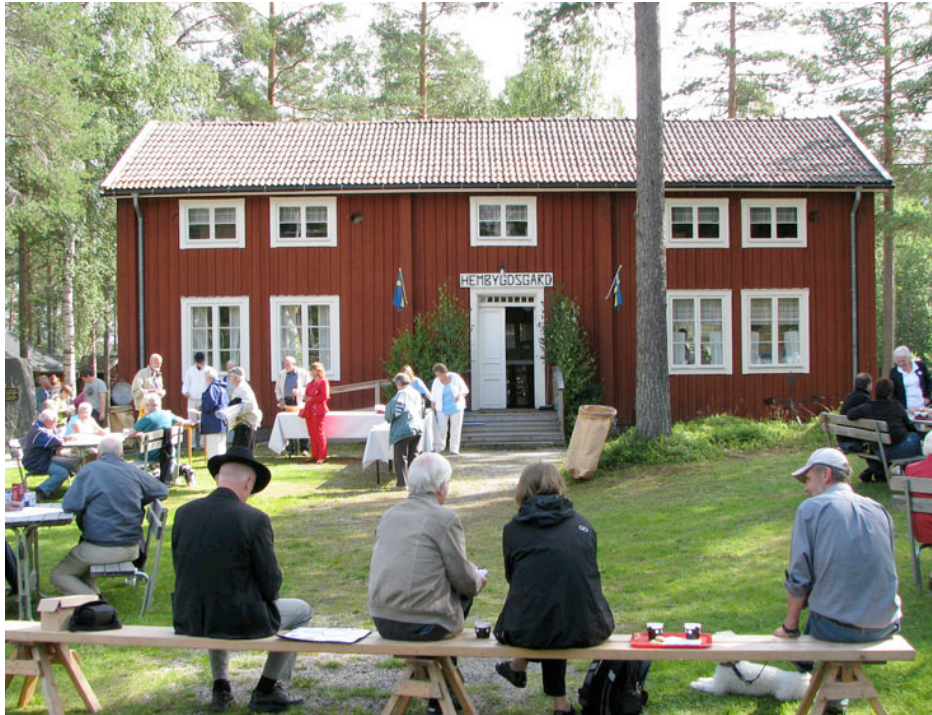
Björna hembygdsgränd, flyttad från Movattnet

Projektarbete Kursen Skogsfinnarna i Skandinavien Mälardalens Högskola 7,5 poäng HT 2009 Tord Eriksson