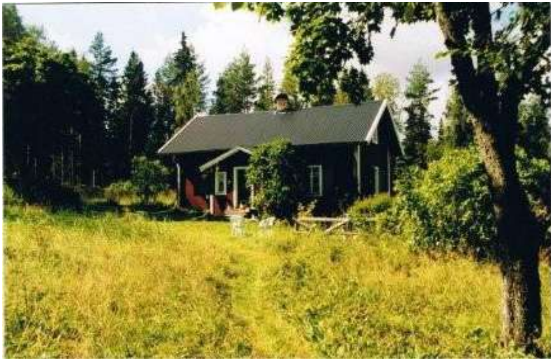
Bredsjönäs.