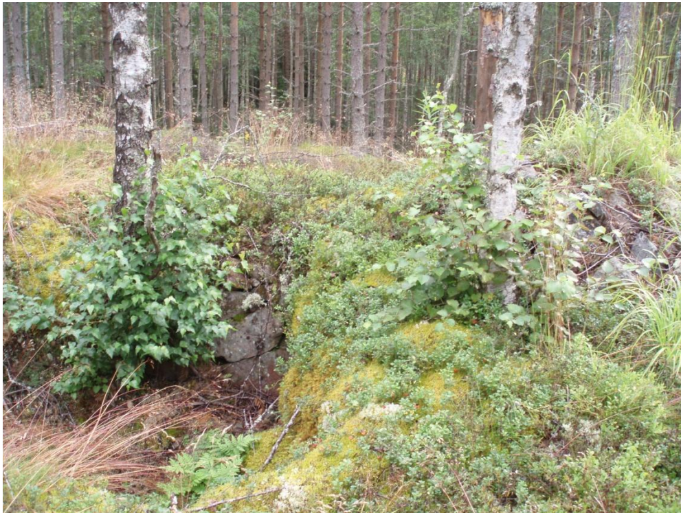
En stensatt källarruin vid bosättningen. Till höger ett spisröse.

I grunden finns en stensatt källargrop, som är rektangulär 2,9 x 2,2 m och 1,3 m djup. Direkt SSÖ om gropen noteras ett ovalt spisröse 2,5 x 2 m. Det är 1 m högt. Ungefär 20 m väster om ovanstående fornlämningar finns ytterligare en trolig husgrund liknande den ovan beskrivna.