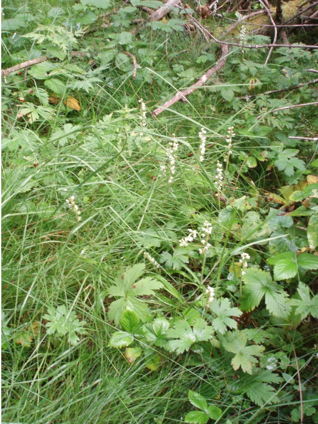
Vid Bergbodarna med dess igenväxande slogar, 5 km norr om Haglingberg, växte detta bestånd av knärot, den lilla grönvita orkidén. Sommaren 2009.