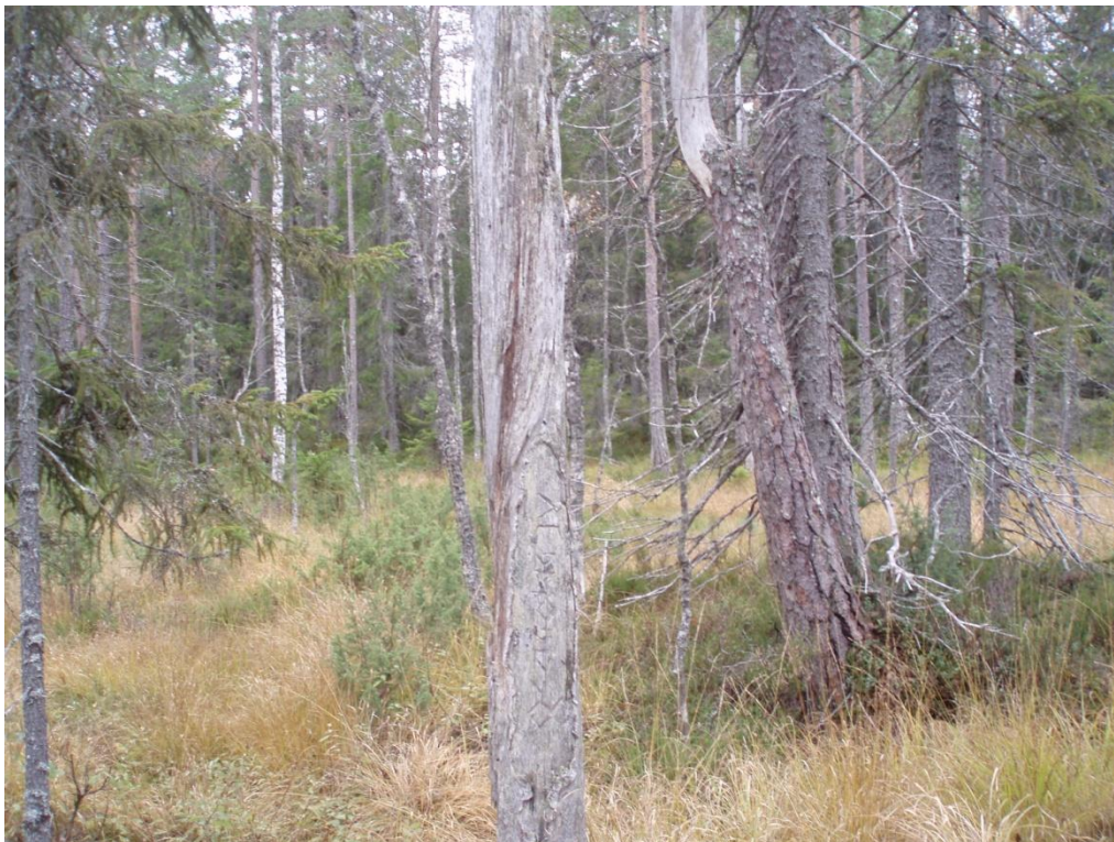
Mellan topparna på Haglingberg finns denna lilla myr med ristningar

I anslutning till bosättningen finns 3 ristningar på de två mindre myrarna mellan syd- och nordtoppen av berget. Tvåhundrafemtio meter väster om bosättningen finns ett 30-tal ristningar på en sovhol samt i anslutning till en myr och ett bäckdrag. Sexhundra meter söder om Bondbodarna och 400 meter öster om berget kan hittas ett 25-tal på en myr. Vid Oxåstjärnen 400 m söder om bosättningen finns ett 15-tal.