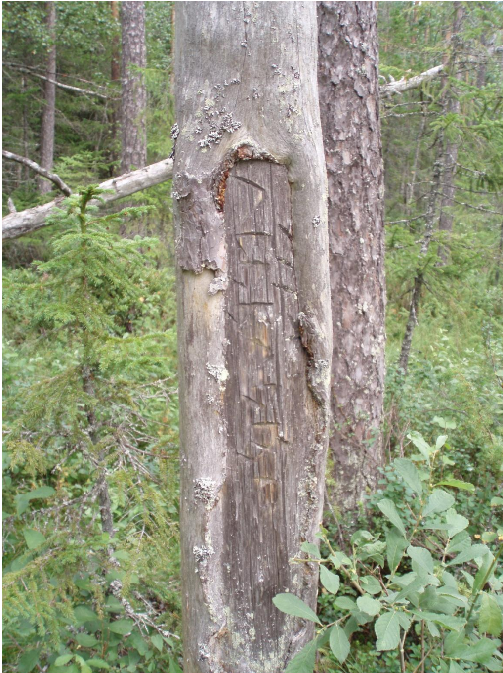
Ristning från en liten myr mellan nord- och sydtoppen av Haglingberg.