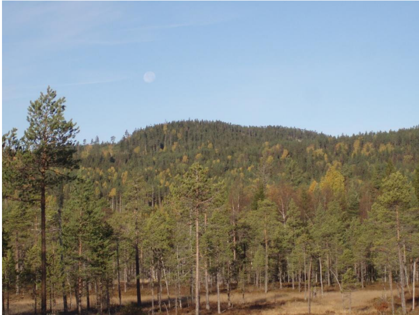
Haglingberg från öster. Här bodde trolljätten Halgarehn (se texten). Fullmånen lyser så grant

gamle storjätten insåg även han problemet och så småningom blev Gunnil havande och födde lyckligen de två jättepojkarna Halvar och Olof. Halvar bosatte sig vid Halvarsbodarna och Olof vid Olersbodarna. Det är troligt, att hela familjen lever än och observerar och skyddar skogsvandraren. Sannolikt har dock Gunnil flyttat till sin make på Haglingberg, eftersom Gunnilåsen sargats svårt av det moderna skogsbruket.