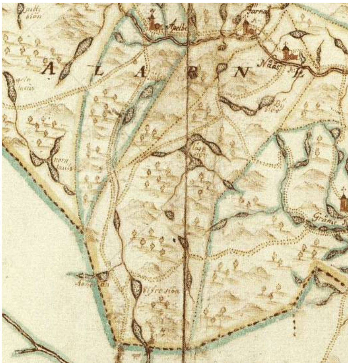
Figur 13 Nås socken

Bebyggelsen var med hänsyn till förutsättningarna, vid tiden för finnarnas ankomst, koncentrerad till sedimentområdena vid Västerdalälven, i kartans nordöstra del. Med tanke på de begränsningar som klimatet hade på möjligheterna till spannmålsodling var boskapsskötseln viktig.