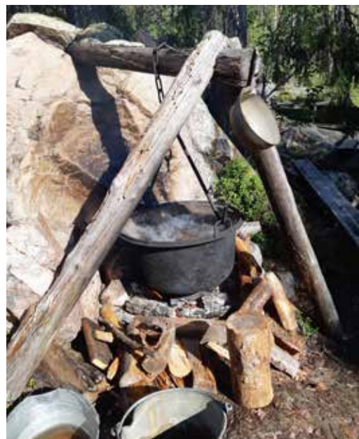
Vatten värmdes över öppen eld.

Lördagen den 28 augusti ägde årets kvarn- och stampdag rum vid Råbergskvarn. Stampens taktfasta dunk genljöd i skogen när elva unga elever från Skattungekursen vid Mora folkhögskola under ledning av läraren Berit Zetterqvist stampade 80 meter ylletyg i vackra nyanser. Kvarnen var också den igång under dagen och där kunde man köpa nymalet mjöl av Johan Smids från Orsa Kvarn.