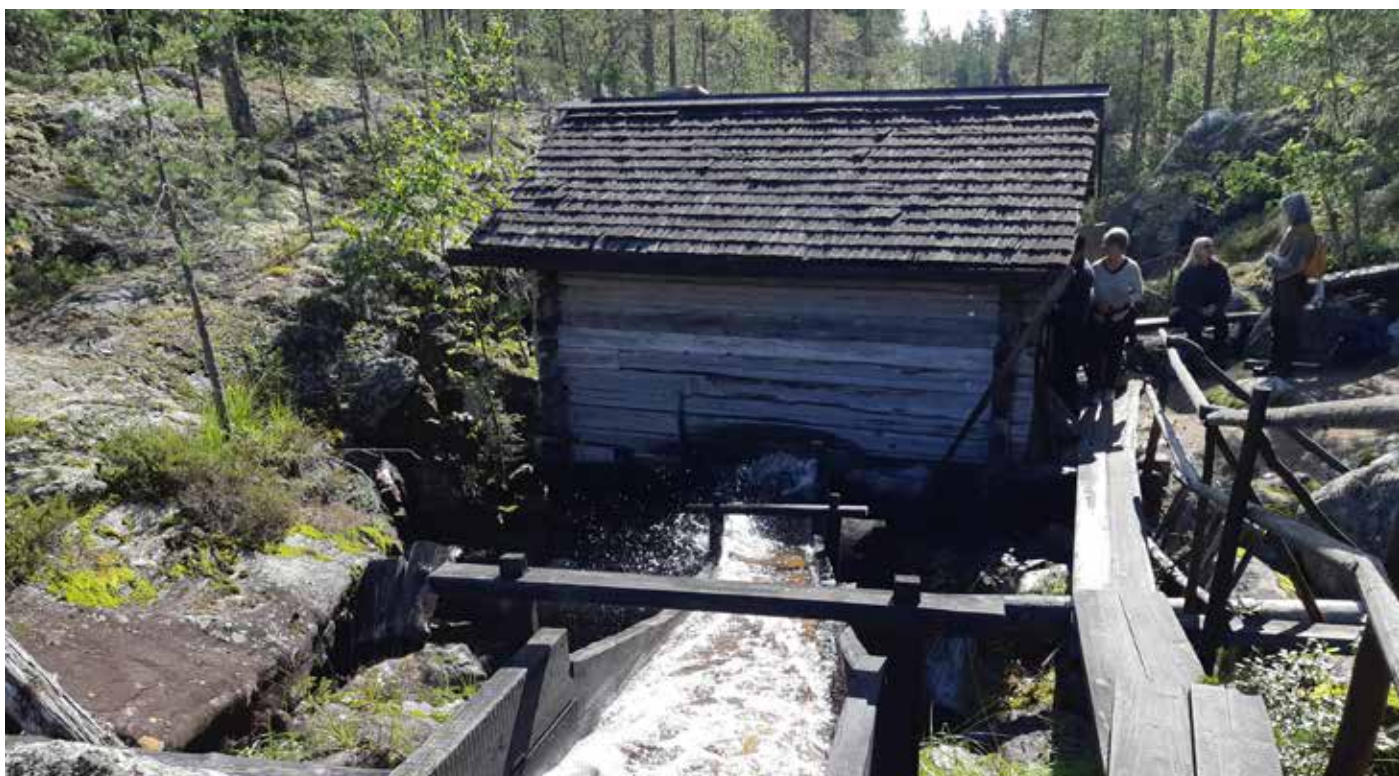
En ränna i trä leder vattnet till kvarnen.