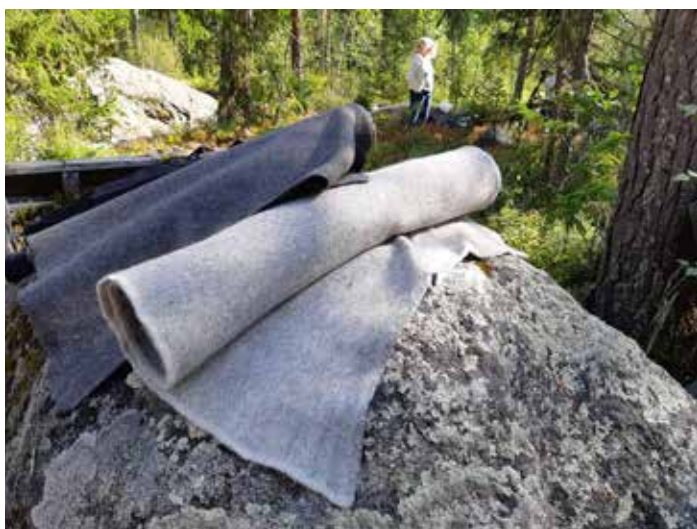
Färdig vadmal i fin miljö.

Vadmal är ett slitstarkt och hållbart ylletyg som var mycket vanligt i äldre tid. Genom stampning, dvs mekanisk bearbetning, fick tyget en filtliknande struktur och blev mycket slitstarkt. Vadmalen var ett funktionsmaterial med stor betydelse för människor liv och arbete.