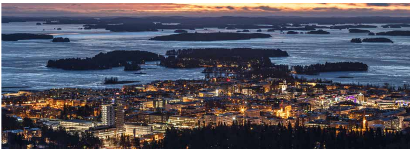
En vy över staden Kuopio.