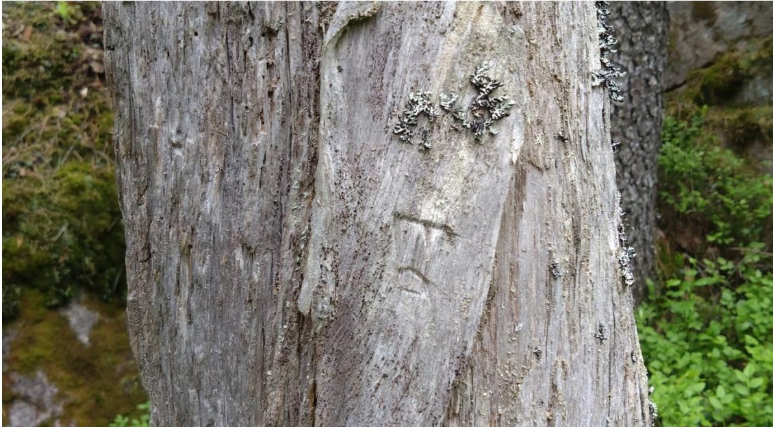
Ett bomärke på Finnekroken, ett vidsträckt skogsområde mellan Karlskoga och Grythyttan.