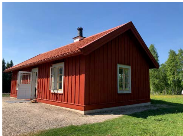
Gamla och nya byggnaden på Gårdsjötorp

Vid bygdegården Nytorp avslutades vår vistelse i trakten med kaffe och hembakat hos Kilsbergens hembygdsförening