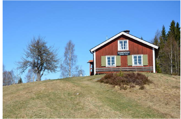
Kilsbergstugan.