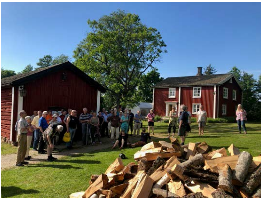
Samling och genomgång av rökstugor. Högan, Hembygdsgård i Fjugesta