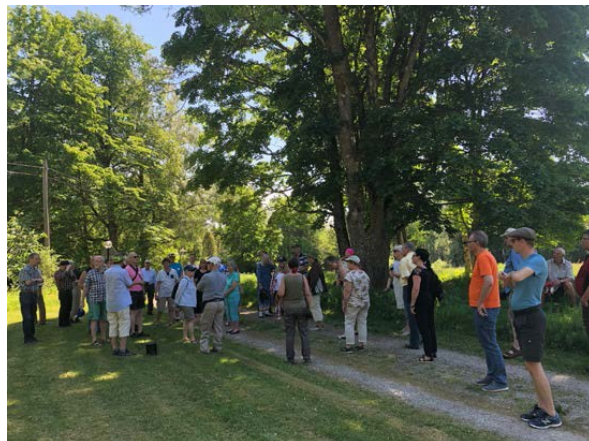
Vandring genom Tryggeboda

I det gamla missionshuset som nu sköts av FTGs byalag bjöds vi på kaffe med dopp.