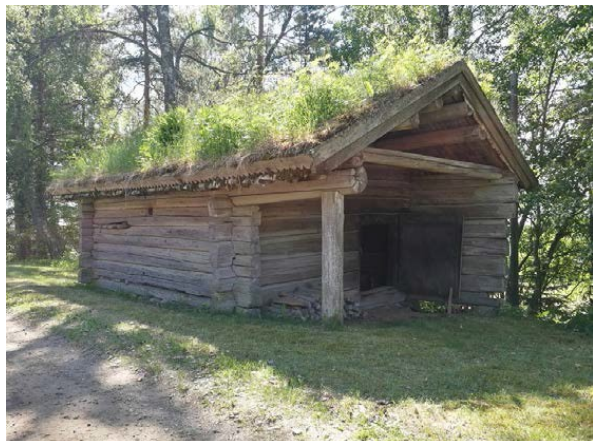
Bastu i Tryggeboda.