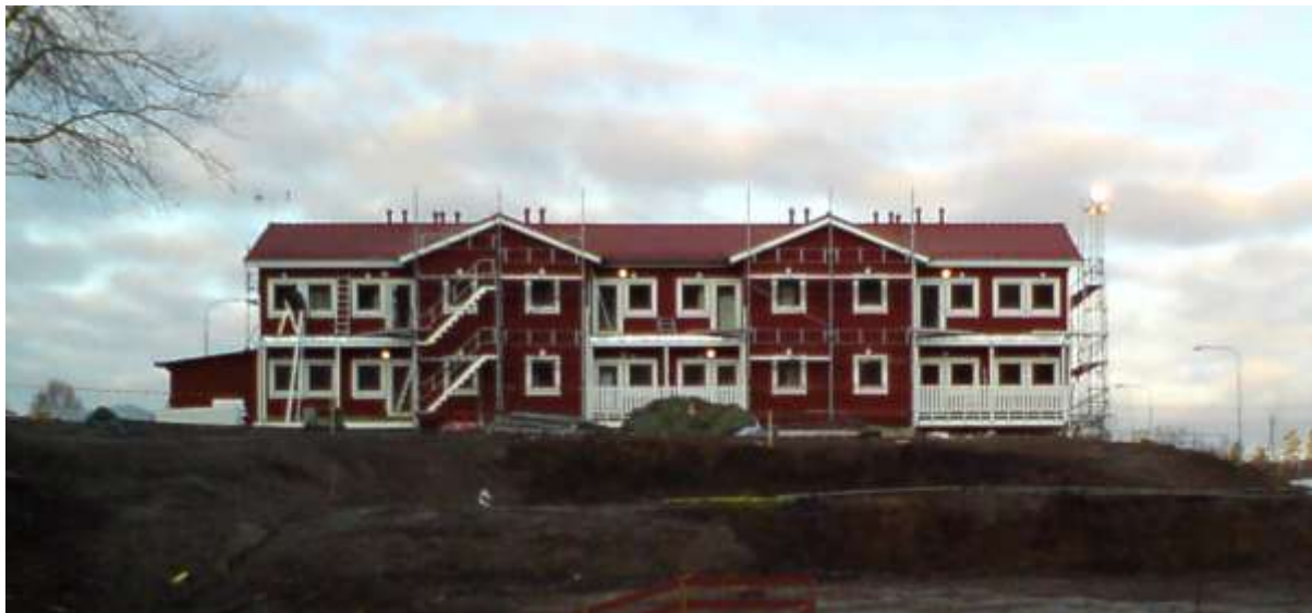
Första huset i etapp ett av Kungsbergets utbyggnad (8 lgh) kom på plats i november 2009.

Denna skidanläggning har anor från 1930-talet och hade år 2009 ca 150 000 besökare. Planer finns för en utbyggnad till en komplett skidort med ca 2 500 bäddar inom gångavstånd till lift eller backe fördelat på 200 stugor, 100 lägenheter samt ett sporthotell med 50-talet rum.