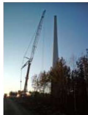
Utsikt från Botjärn mot öster samt bilder från byggsplatsen på Vettåsen, november 2009