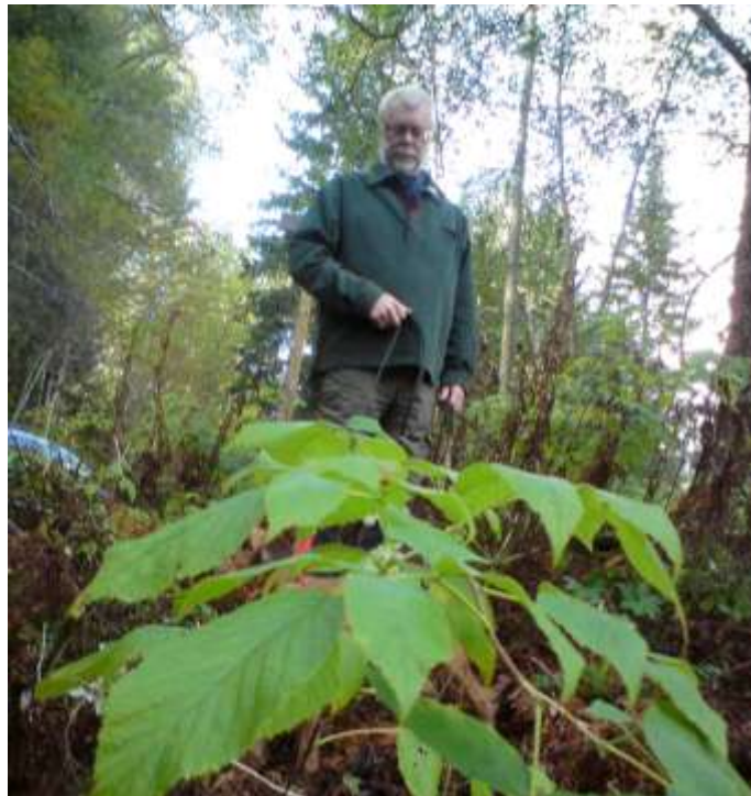
Actaea Spicata, Trolldruva, nordlig art vid Eskilsbron.

Ovansjö Ekopark som omfattar ca 3 300 ha söder om Botjärn, har avsatts av Sveaskog som reservat enligt naturvårdsavtal med Skogsstyrelsen för att säkra ett långsiktigt skydd för natur- och kulturvärden. Större delen av ekoparkens höga naturvärden finns i de gamla granskogarna. I Sveaskogs beskrivning av Ekoparken sägs "förutom kolbottnar och milor finns även spår av fäbodrift och folktrö." Kungsberget är ett attraktivt område för det rörliga friluftslivet med den alpina anläggningen, längdskidspår, skoterleder, vandringsleder, cykelvägar, grillplatser och möjligheter till fiske, bär- och svampplockning.