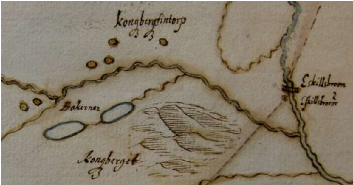
Stenklyfts karta över bl.a Botjärn, Kungsberg och Eskilsbron 1702