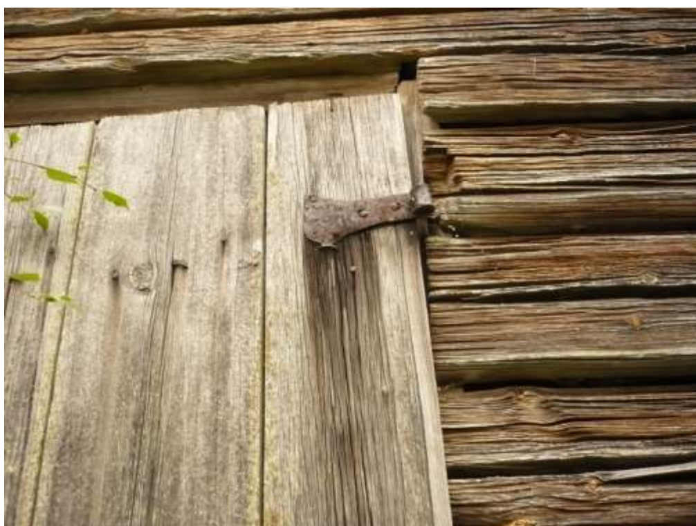
Detalj av ladan