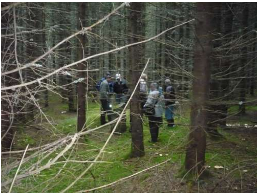
Människor i skog letar spår efter mänskligt liv