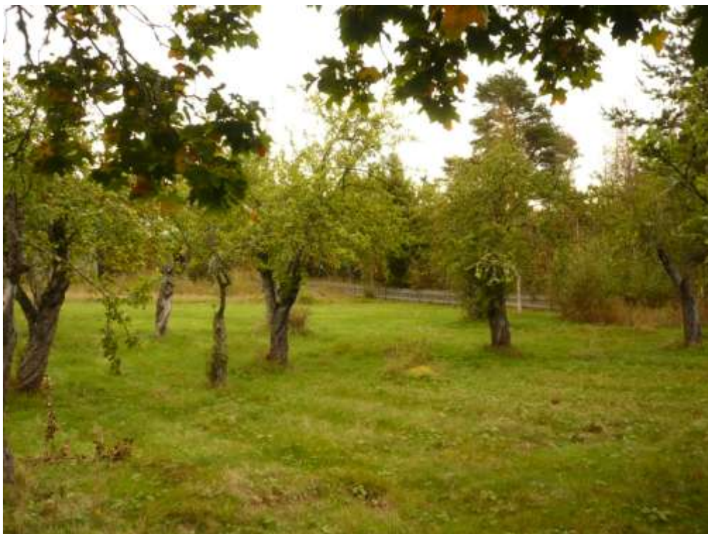
Den förvildade äppelträdgården, planterad på 1840-talet

Omslagsbilden visar ett av äppelträden med klösmärken efter björn.