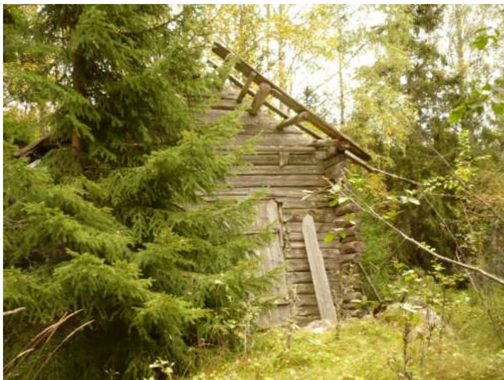
Lada i skogen