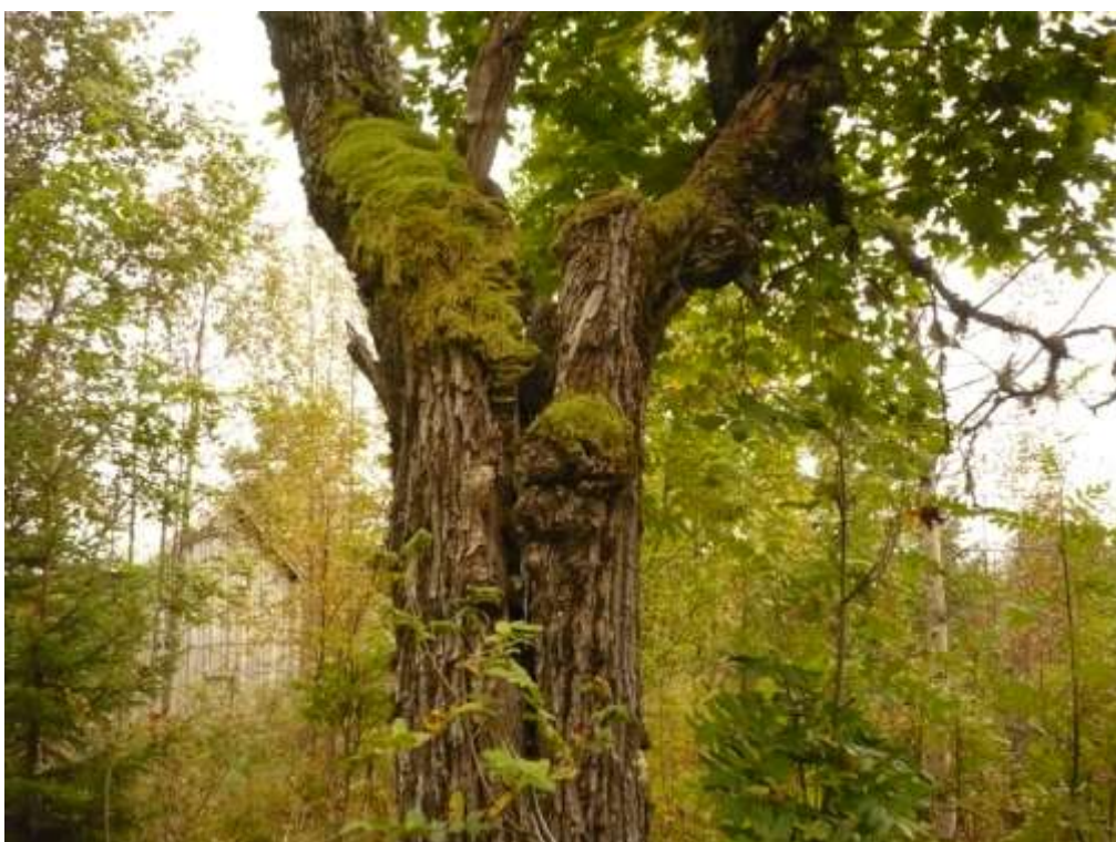
En gammal lönn som blixten troligtvis slagit ned i