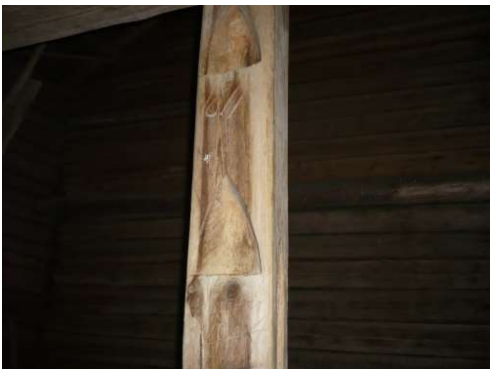
Stege med årtal